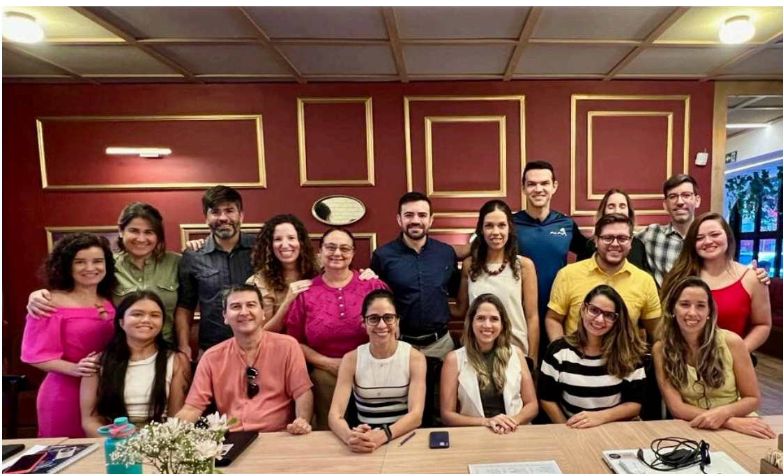
Reunião colegiada de docentes, servidor técnico e representantes discentes para o planejamento estratégico do colegiado do PPGFisio. 06/09/2024.