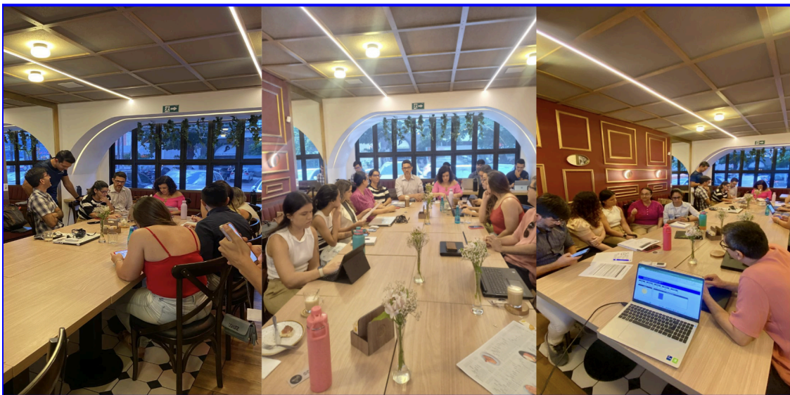
Reunião de planejamento estratégico do colegiado do PPGFisio. Momentos de discussão ampliada e em grupos segundo objetivos estratégicos do PDI e quesitos da CAPES. 06/09/2024.